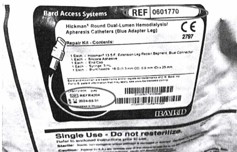
Рисунок 2. Определение на пакете изделия каталожного номера изделия, номера партии (LOT) и даты истечения срока годности

Юридический адрес 121596, г. Москва, ул. Горбунова, д.2, стр. 3, эт. 5, пом. II, ком. 1, офис А-500.1 каб. 5. Тел.: +7 (495) 775-85-82, факс: +7 (499) 372-5003