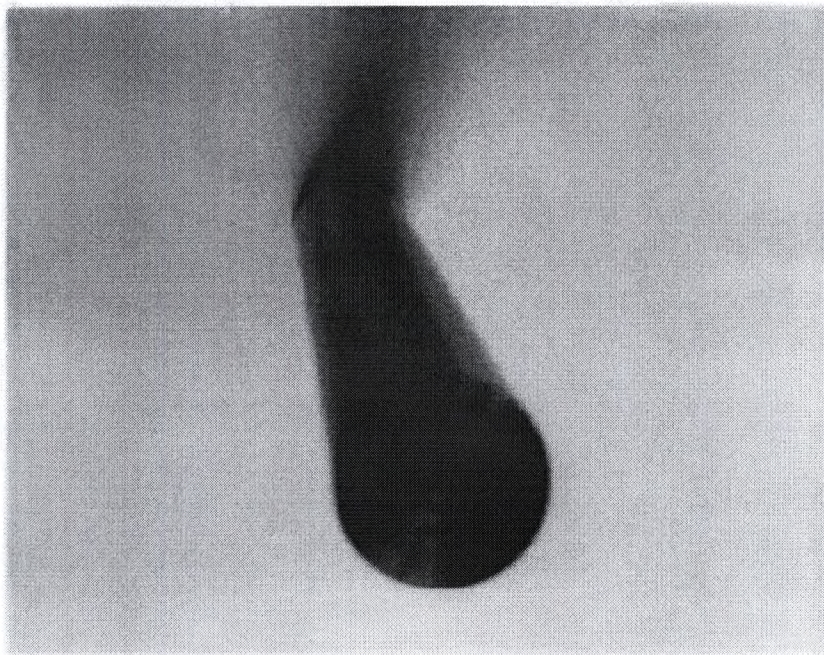
Внешний вид образца изделия.