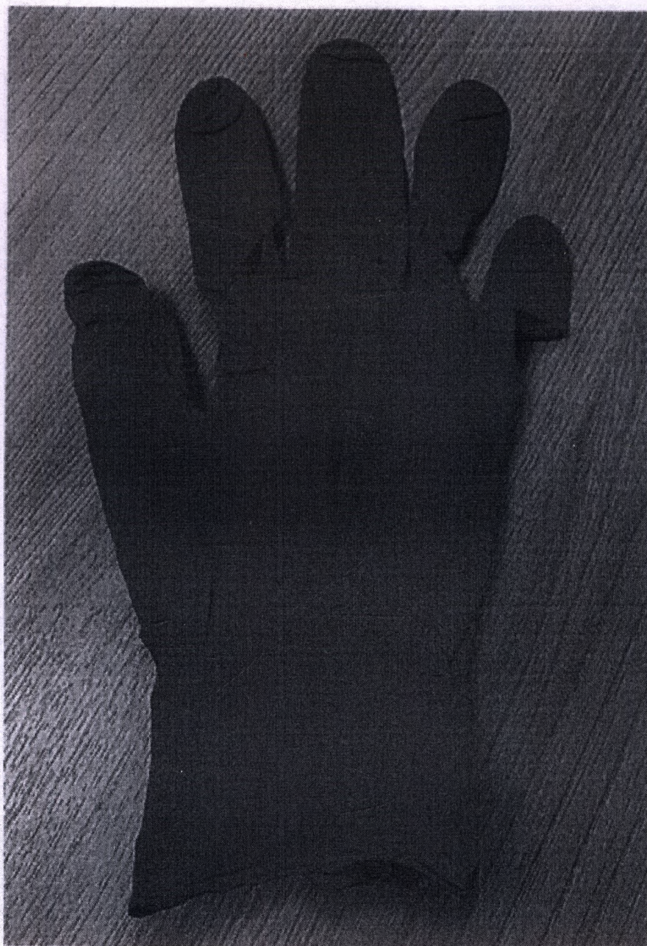
Внешний вид перчатки