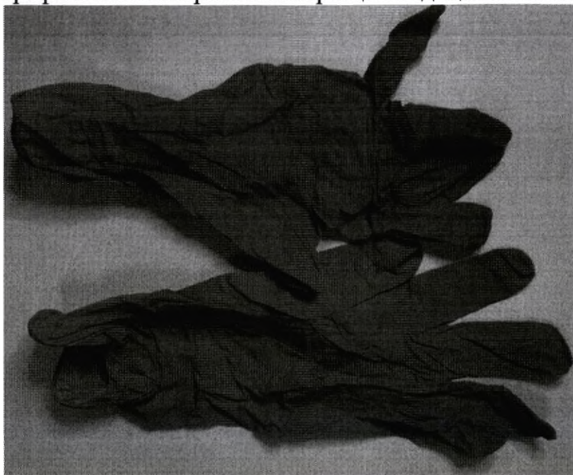
Общий вид образцов