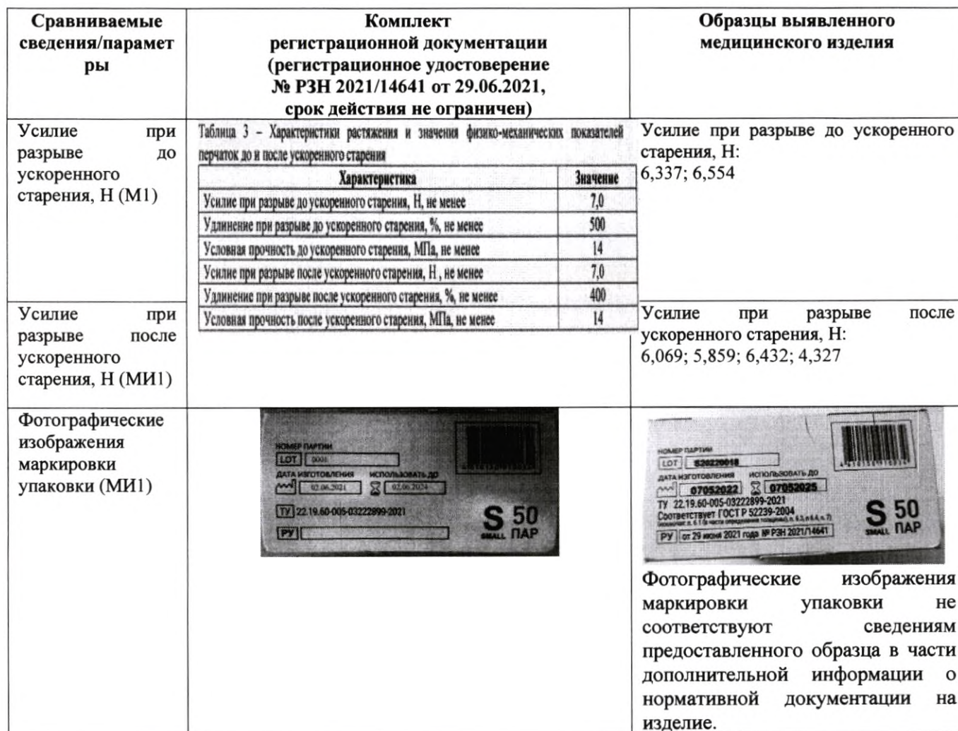
Таблица сопоставления параметров и характеристик, указанных в комплекте регистрационной документации, с параметрами и характеристиками образцов выявленного медицинского изделия

Приложение к письму Росздравнадзора от 14.04.2023 № ОИЧ-252/23 .