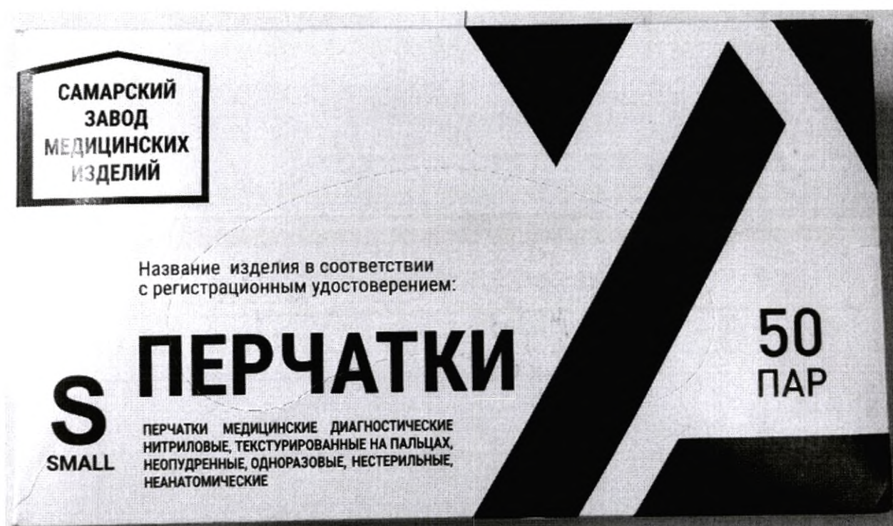
Общий вид упаковки