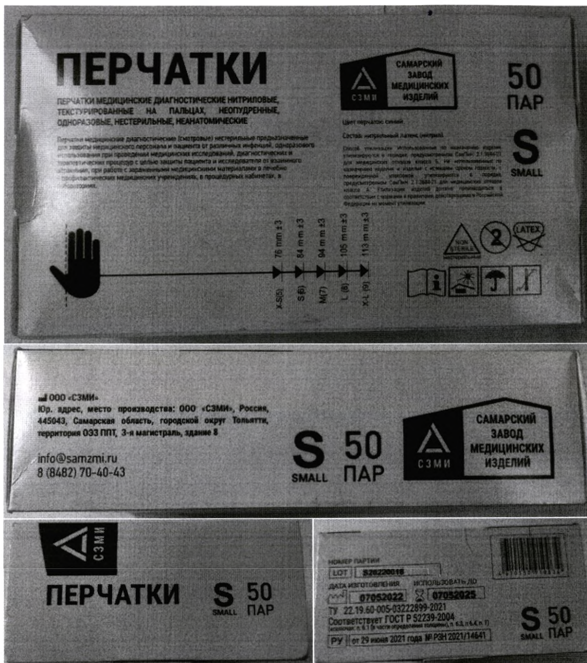
Маркировка потребительской упаковки