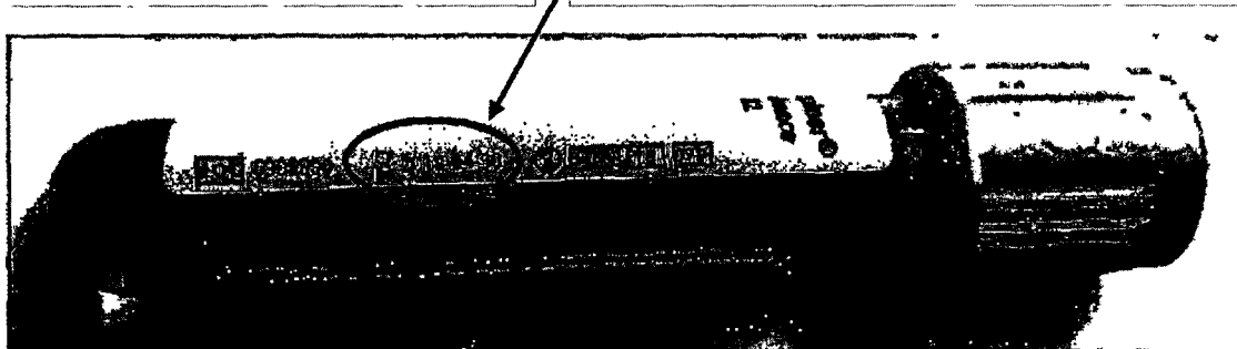
Таблица 1. Подробное описание затронутых изделий

Корректную дату читать следующим образом: 30.10.2017