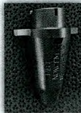
Рис. 1: Пробойный инструмент MBT Non-Keel Punch

В результате внутреннего расследования было обнаружено, что дизайн инструмента непреднамеренно увеличивал высоту пробойника. Увеличение высоты на 0,063 дюймов (1,6 мм) является разницей между примерочным компонентом и инструментом (см. Рис. 2). Есть вероятность, что во время примерки компонента по этой причине врач мог бы ошибочно выбрать слишком тонкий вкладыш.